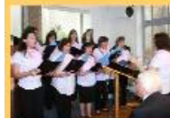
Coro da Igreja