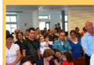
Sal da terra com participação da Escola Dominical

Que o Senhor seja glorificado em tudo quanto foi realizado.