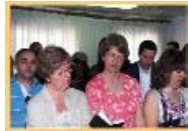
Ceia do Senhor nº 39