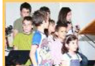
Sal da terra com participação da Escola Dominical