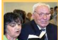
Entoando o hino nº 469