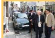
Desfile até ao nº 80