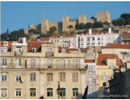
Igreja em Olarias Lisboa Lisboa, Julho de 2005