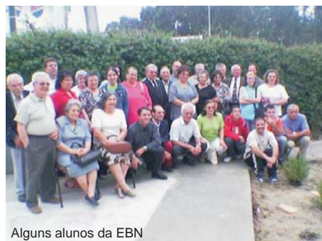
Alguns alunos da EBN

Queremos agradecer a vossa graciosa comunhão connosco na Obra. Que o nosso amoroso Pai supra as necessidades de todos os que lhe são fiéis.