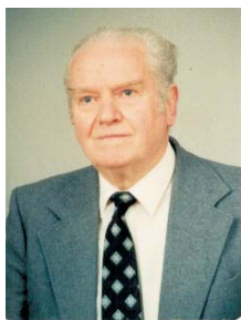
Por Frank Smith