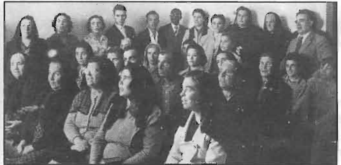
Fotografia dos membros da igreja do (Carrascal talvez há 40 anos).

"Não posso deixar de escrever algumas palavras para exprimir o que sinto pela perda do nosso amigo e irmão em Cristo. Sentimos imenso a sua falta cá na nossa terra—o Carrascal/ Esperamos que o nosso bom Deus o tenha recebido de braços abertos, pois ele assim o merecia. Era uma pessoa que ao longo de 50 anos nos fez sempre companhia, desinteressadamente, nunca