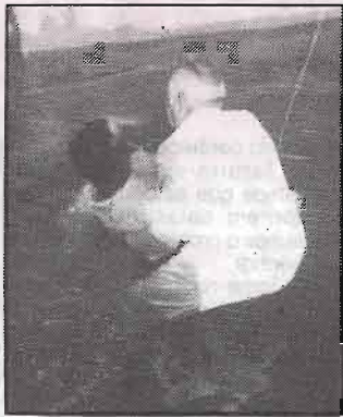
Baptizando em Gouveia.

Era tema de conversa na nossa casa: " Vou ver se levo hoje um pregador ao Carrascal.... Hoje não tenho dinheiro para os transportes, mas o Senhor vai ajudar-me.... Ontem perdi o combóio e fiquei para hoje no banco da Es-